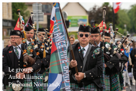
Le groupe Auld Alliance Pipeband Normandy