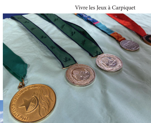
Vivre les Jeux à Carpiquet