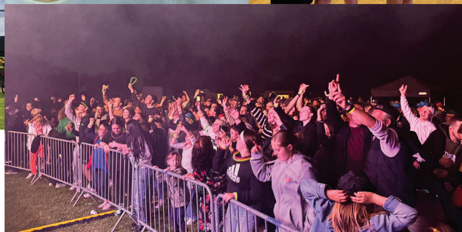
Fête de l'été