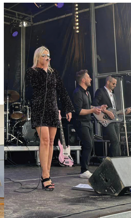
Fête de l'été