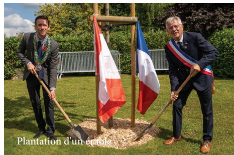
Plantation d'un érable