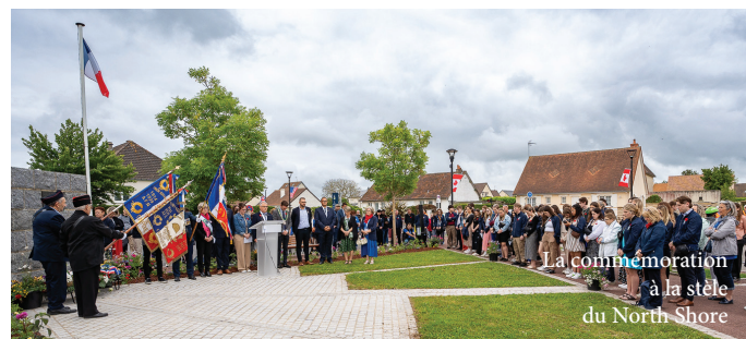
La commémoration à la stèle du North Shore