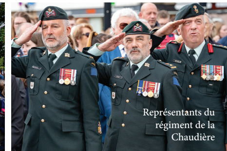
Représentants du régiment de la Chaudière