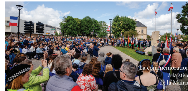
La commémoration à la stèle de la Mairie