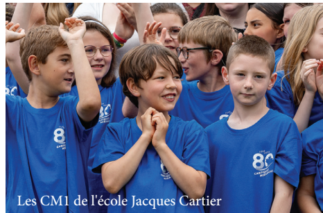
Les CM1 de l'école Jacques Cartier