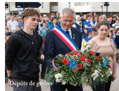
Dépôts de gerbes