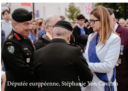
Députée européenne, Stéphanie Yon Courtin