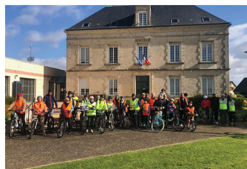
Balade à vélo