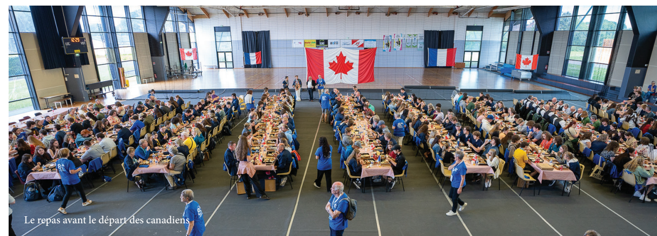
Le repas avant le départ des canadiens