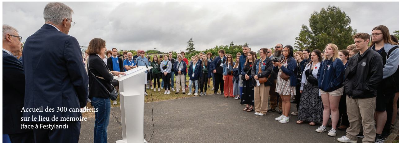
Accueil des 300 canadiens sur le lieu de mémoire (face à Festyland)