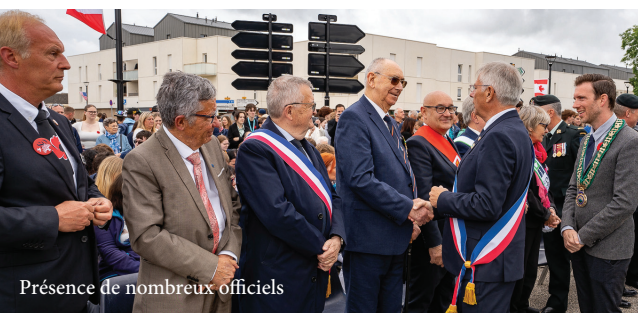
Présence de nombreux officiels