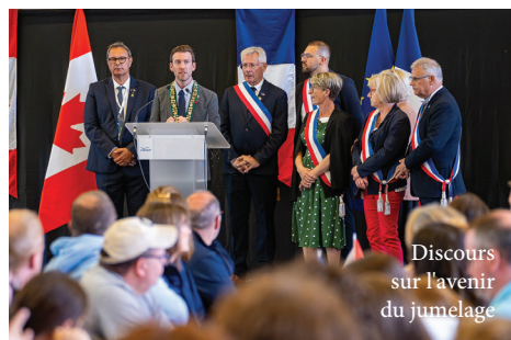
Discours sur l'avenir du jumelage